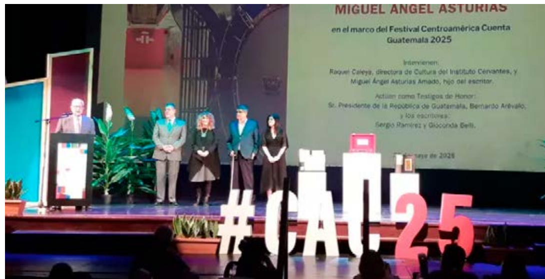
Acto del legado in memoriam del premio nobel de literatura Miguel Ángel Asturias, celebrado en Ciudad de Guatemala.