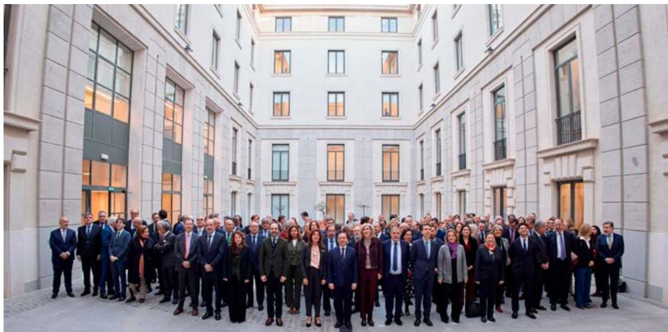
El ministro Albares inaugura la Conferencia de Embajadores y Embajadoras 2025 en la sede del Ministerio de Asuntos Exteriores, Unión Europea y Cooperación, bajo el lema «Una política exterior con identidad propia».

La participación del Instituto Cervantes en este encuentro subraya su papel clave en la proyección internacional de la lengua española y de la cultura en español.