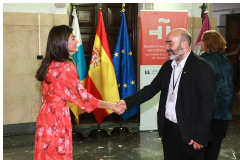
Saludo institucional previo a la reunión de trabajo con Su Majestad la Reina.