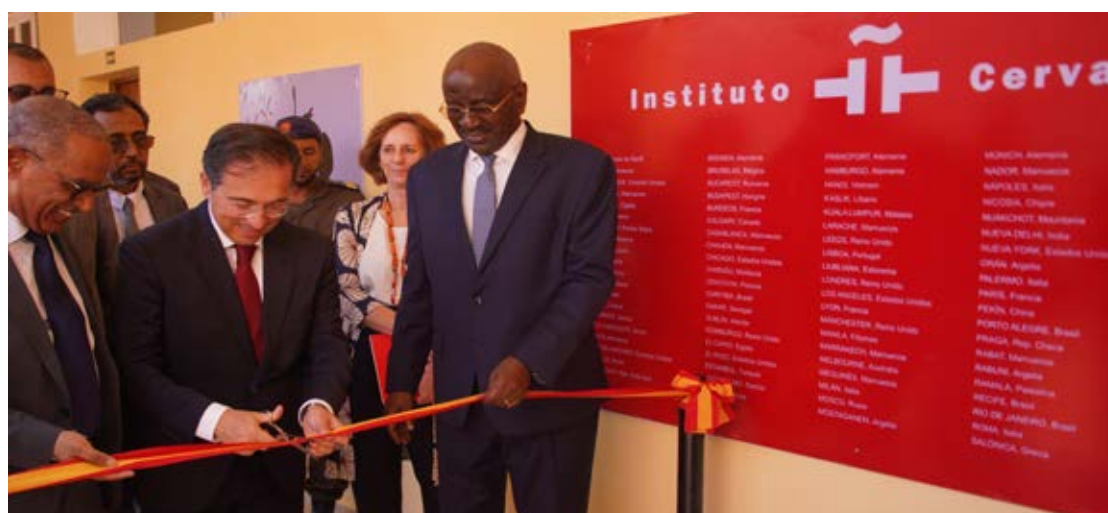
El ministro de Asuntos Exteriores, Unión Europea y Cooperación, José Manuel Albares, cortando la cinta inaugural de la extensión del Instituto Cervantes en Nuakchot (Mauritania).

Esta extensión, que se ubica en la Universidad Al Aasriya de la capital mauritana, consolida el compromiso asumido en la Declaración de 27 de agosto de 2024 entre España y Mauritania, y abre el camino para explorar nuevas vías de colaboración en la enseñanza del español, la formación de profesorado y el intercambio cultural entre ambos países.