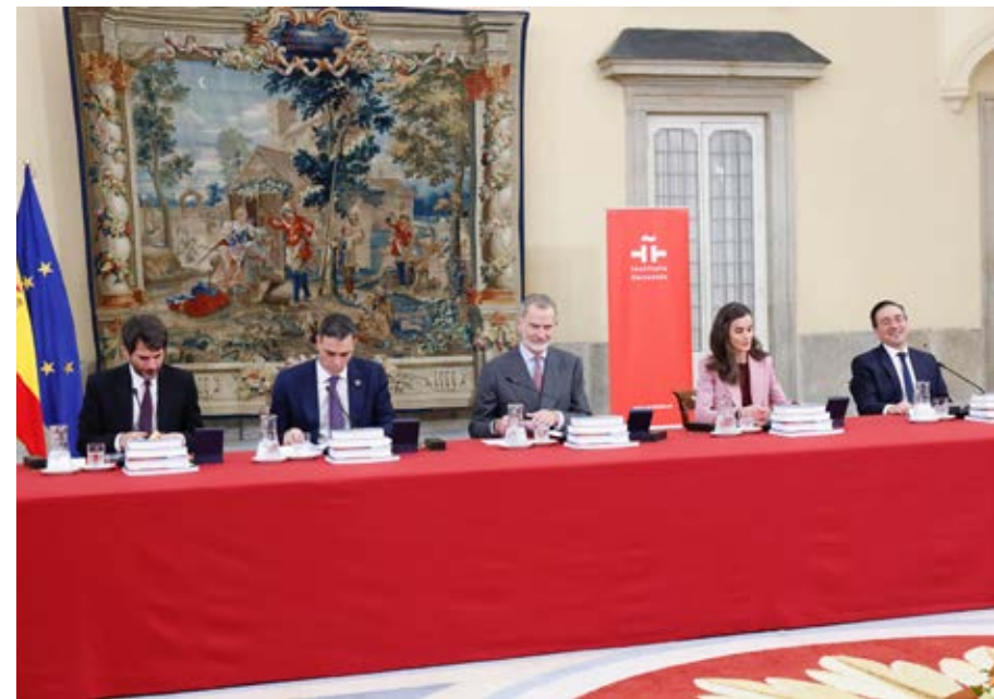
Intervención de Su Majestad el Rey.

Felipe VI también señaló el camino de ida y vuelta que supone la convivencia del español con las lenguas indígenas de los territorios hispanoamericanos, como el quechua o el aimara. Para el Rey, la celebración del Congreso Internacional de la Lengua Española en Arequipa (Perú) el próximo mes de octubre, con el mestizaje y la multiculturalidad como tema central, supone una gran noticia. El monarca celebró también el crecimiento de manera sostenida de estudiantes de español en todo el mundo un 2 % anual, un aumento que se atribuye no solo al crecimiento demográfico, sino a intereses económicos y profesionales.