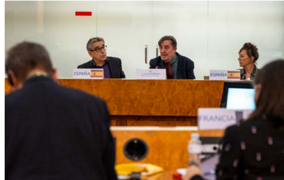
Intervención del director del Instituto Cervantes en las consultas regionales preparatorias de la Conferencia Mundial de la UNESCO sobre Políticas Culturales y Desarrollo Sostenible MONDIACULT 2025, celebradas en la sede central del Instituto Cervantes.

En el marco de estas consultas preparatorias intervino el director del Instituto Cervantes, Luis García Montero, para dar la