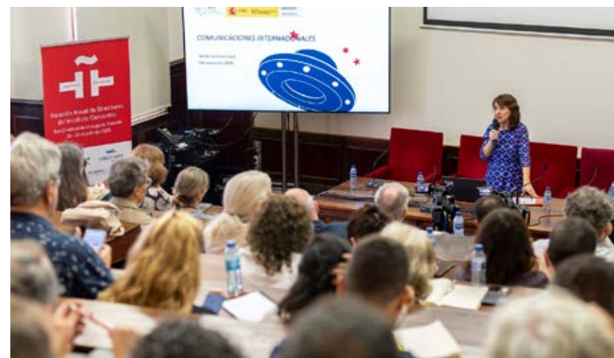
Sesión de trabajo de Transformación y Comunicación Digital: «Un viaje desde el ecuador».