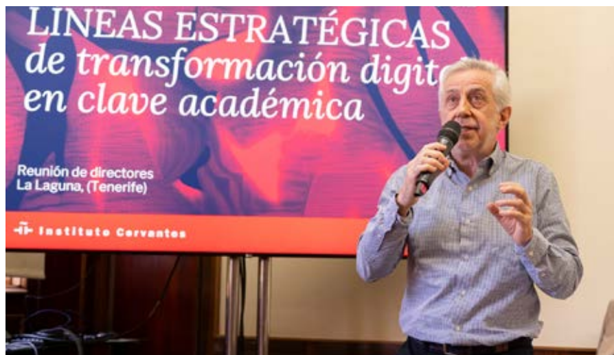
Sesión de trabajo de Académica: «Líneas estratégicas de transformación digital en clave académica».