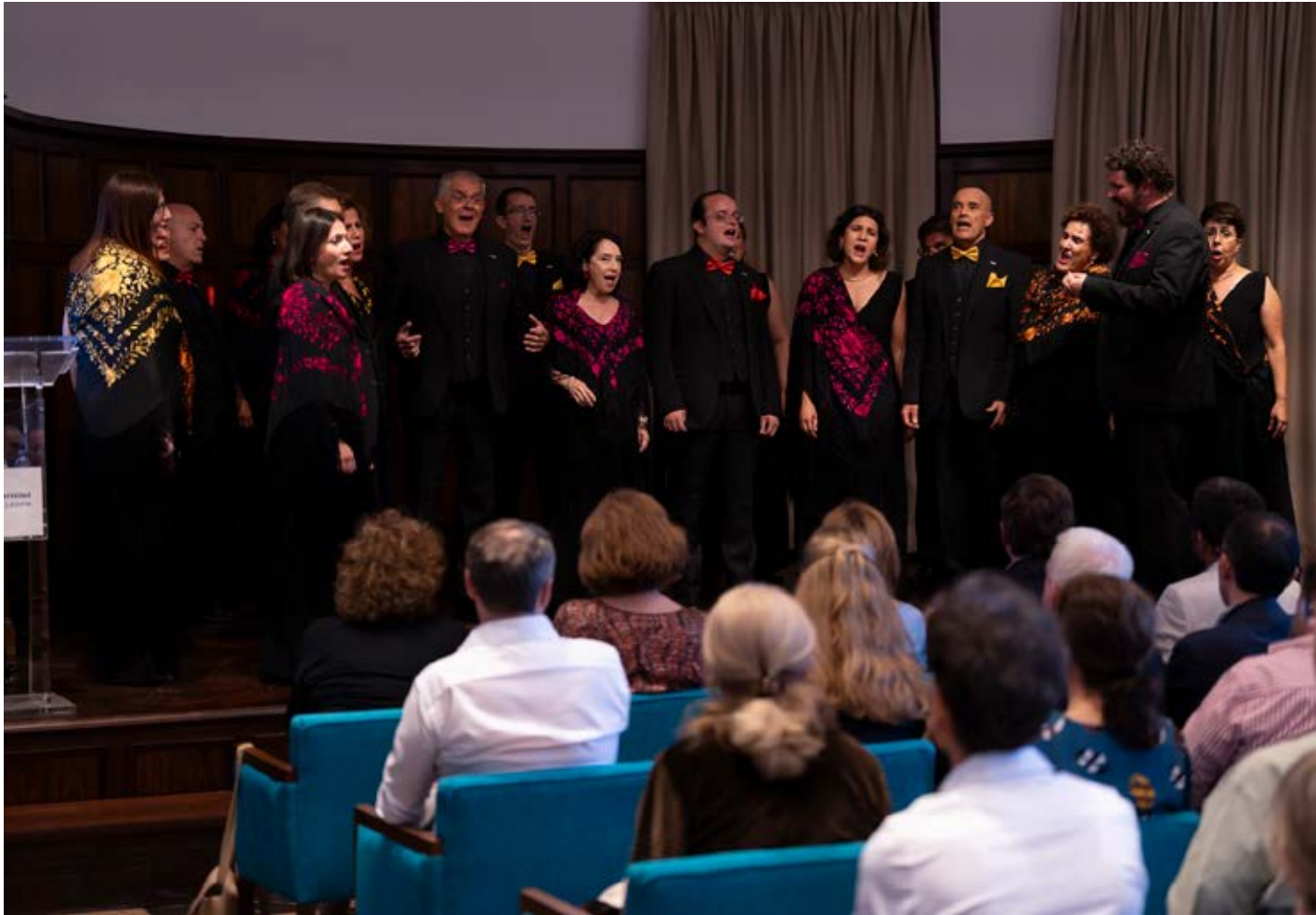
Actuación musical de la Camerata Lacunensis.

Como cierre de la Reunión Anual del Instituto Cervantes se celebró también una actuación de la Camerata Lacunensis.