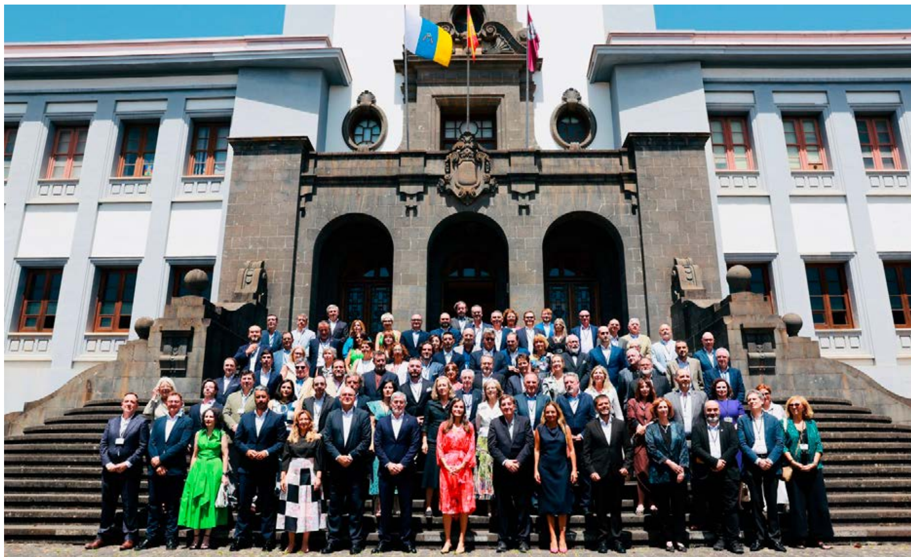
Su Majestad la Reina con los directores y directoras de centros del Instituto Cervantes y autoridades en la Universidad de San Cristóbal de La Laguna, Tenerife.