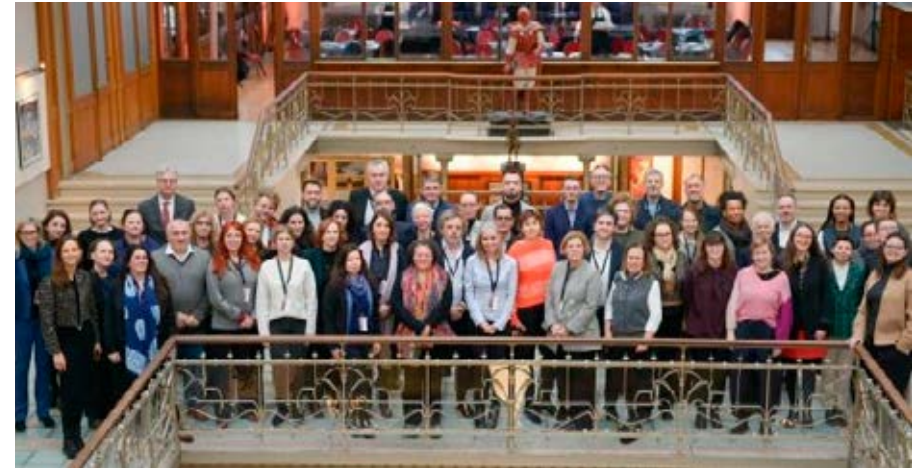
Foto grupal de los asistentes a las Asambleas Generales de EUNIC.