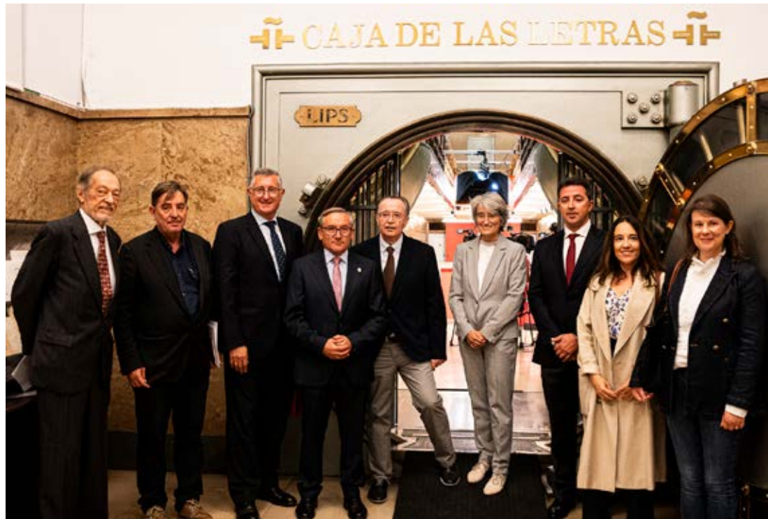
El director del Instituto Cervantes y los participantes en la entrega del legado de la revista Turia .

revista; unos marcapáginas conmemorativos creados por el artista Isidro Ferrer; otro ejemplar (el número 145-146), dedicado a Luis Buñuel; más de mil páginas de textos inéditos, que contienen las ilustraciones de Gonzalo Tena (autor de la cabecera que identifica la revista); una figura del año 1985 realizada por el escultor Pablo Serrano; los Cuentos de Bloomsbury , de la escritora zaragozana Ana María Navales, y tres diarios del propio Maícas ( La nieve sobre el agua , La marea del tiempo y Días sin huella ).