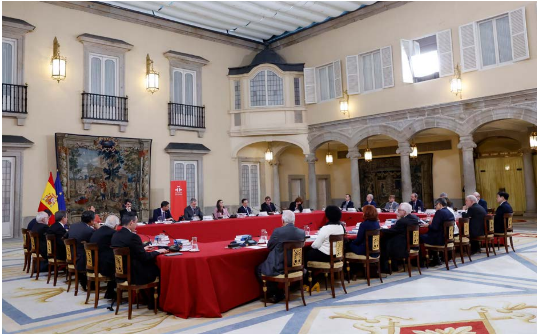
Mesa de la reunión del Patronato del Instituto Cervantes.