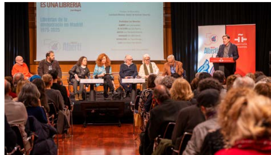
Participantes en la mesa redonda de «La libertad es una librería» con motivo del 50.º aniversario de la Librería Rafael Alberti.