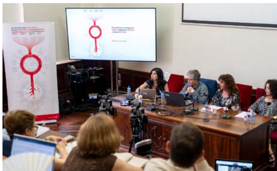
Sesión de trabajo de Cultura: «Una cultura en red, una red de cultura».