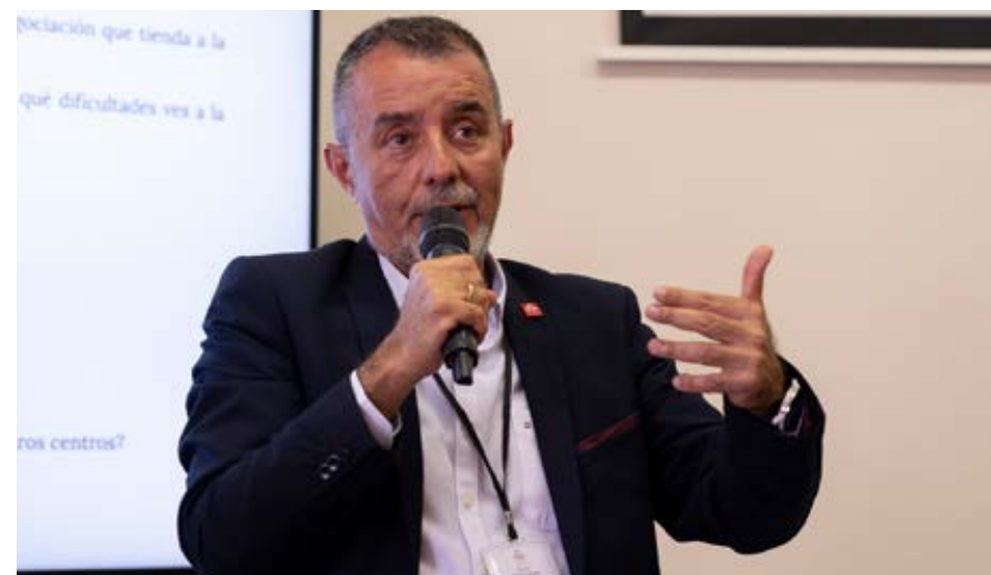
Sesión de trabajo de Recursos Humanos: «12 áreas de mejora en Recursos Humanos».