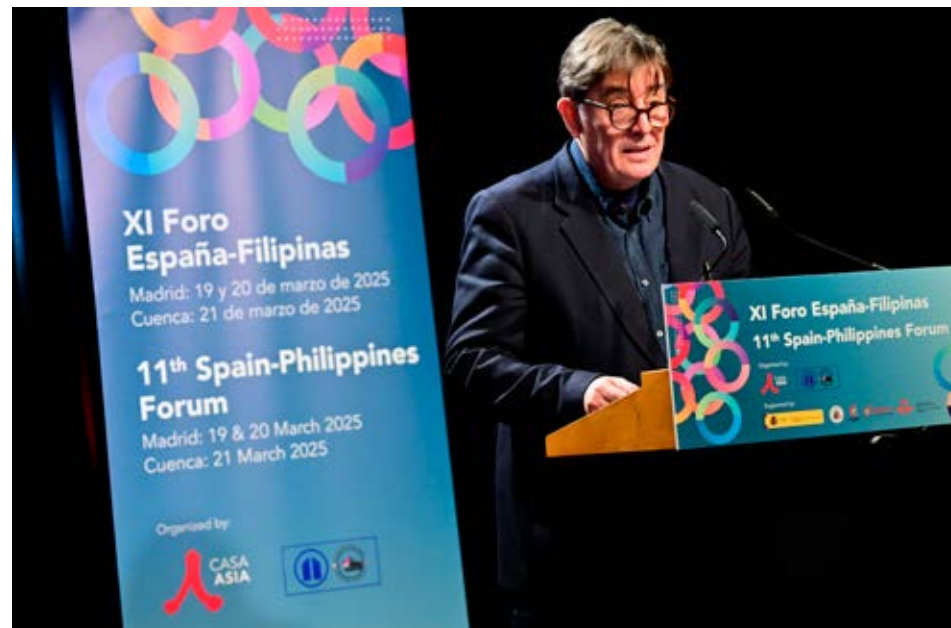
XI Foro España-Filipinas celebrado en el Instituto Cervantes.

El XI Foro España-Filipinas fue clausurado por los embajadores de España en Manila y de Filipinas en Madrid.