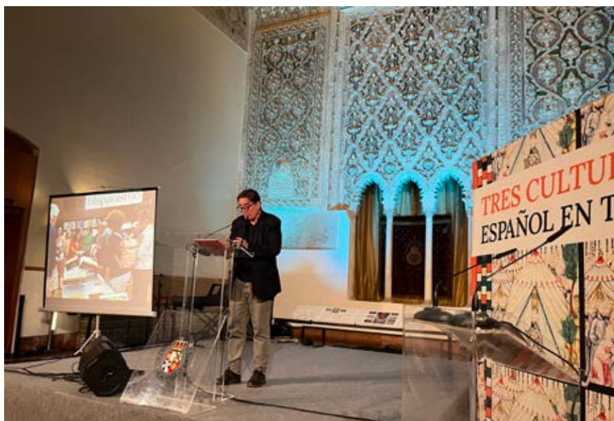
Celebración de una nueva edición del ciclo «Tres culturas: español en Toledo», organizado por el Instituto Cervantes y la Fundación General de la Universidad de Castilla-La Mancha.

El programa académico se completó con «Después de Sefarad, cinco siglos construyendo la identidad sefardí», que empezó el 30 de junio y duró hasta el 4 de julio, repasando el devenir histórico y cultural de la comunidad sefardí desde su expulsión de España hasta la actualidad.