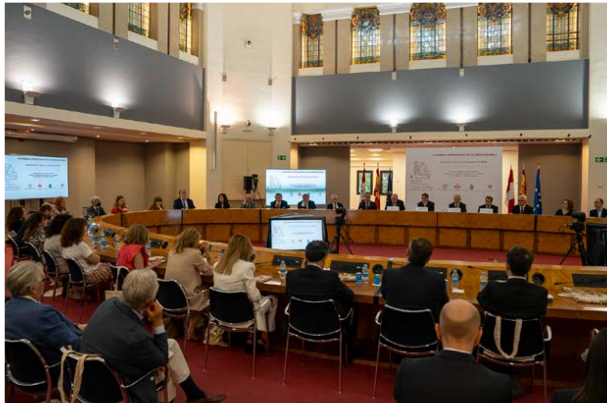
Mesa de la presentación del X CILE en la sede central del Instituto Cervantes.

El acto contó con la participación del director del Instituto Cervantes, Luis García Montero; el director de la Real Academia Española (RAE) y presidente de la Asociación de Academias de la Lengua Española (ASALE), Santiago Muñoz Machado; y el