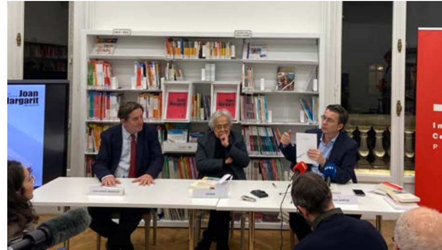
Rueda de prensa en torno al Premio Internacional Joan Margarit. En el centro de la fotografía, Adonis, poeta premiado.