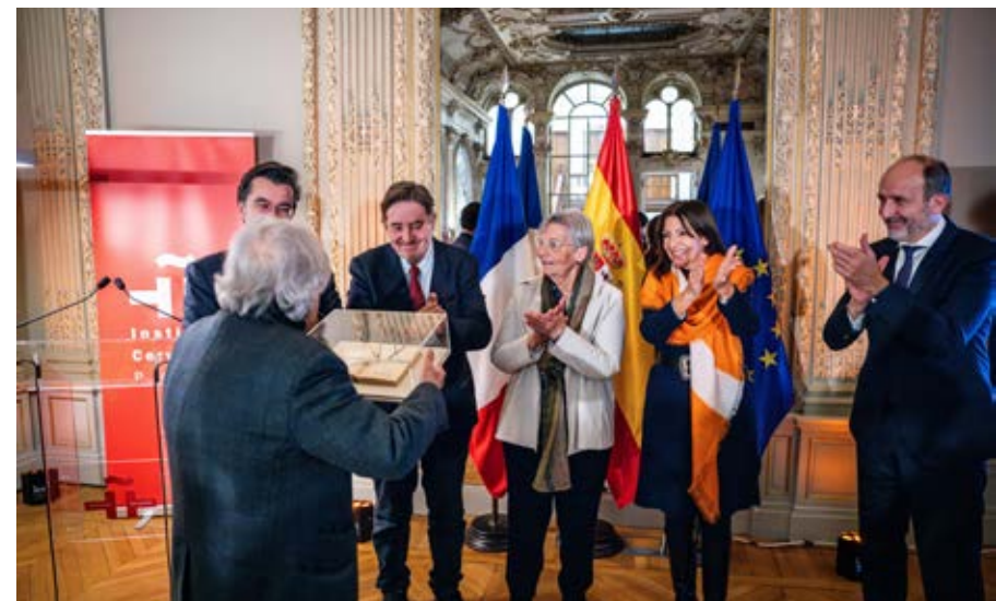
Adonis sosteniendo el Premio Internacional Joan Margarit de Poesía.