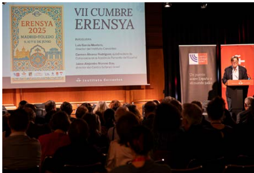
Inauguración de la VII Cumbre Erensyá, que contó con la intervención del director del Instituto Cervantes, la subdirectora de Coherencia en la Acción de Fomento del Español y el director del Centro Sefarad-Israel.

A la conclusión, el director del Cervantes ofreció la conferencia «El futuro del español y la ciencia con raíces», que sirvió como apertura de una serie de ponencias y debates en torno a temas