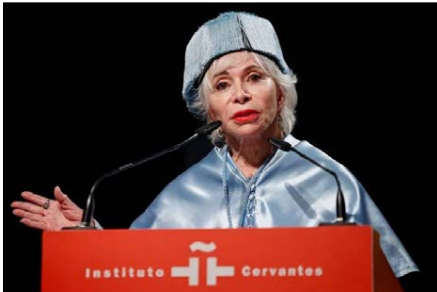
Acto de investidura de Isabel Allende como doctora honoris causa por la Universidad Internacional Menéndez Pelayo.