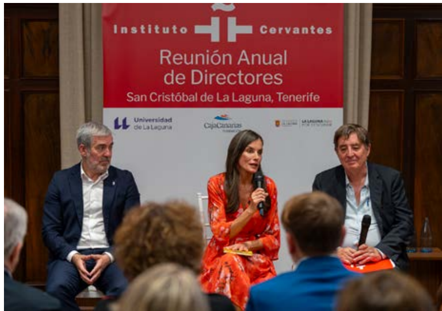
Intervención de S. M. la Reina.