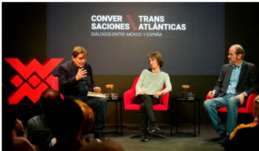
Coloquio celebrado en Casa de México para el ciclo de «Conversaciones Transatlánticas» en colaboración con el Instituto Cervantes.

Seis librerías madrileñas nacidas en la Transición española reivindicaron el 14 de marzo, con motivo del 50.º aniversario de la Librería Rafael Alberti, la importancia de estos establecimientos en la consolidación de la democracia en España en un acto bajo el título de «La libertad es una librería» (que recuerda la cita del poeta Joan Margarit).