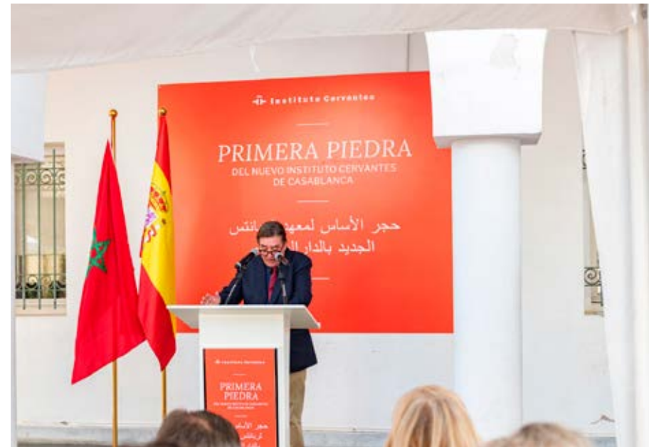
Palabras de Luis García Montero, director del Instituto Cervantes.