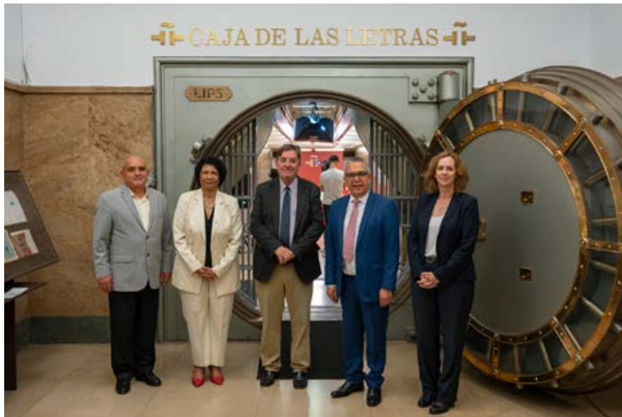
Participantes en el legado de la Universidad de La Habana.