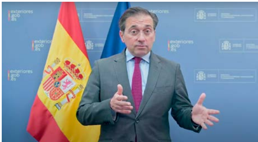
Intervención por vídeo de José Manuel Albares, ministro de Asuntos Exteriores, Unión Europea y Cooperación.

También aludió a los retos futuros, con proyectos para el próximo año como el lanzamiento de un diccionario de iberismos de relaciones España-Portugal, o la preparación para otoño de un diccionario Vargas Llosa, además de una antología poética de Oswaldo Chanove. Para García Montero, el balance habla de «la fuerza» de la institución en un momento complicado, con especial atención a las «limitaciones presupuestarias».