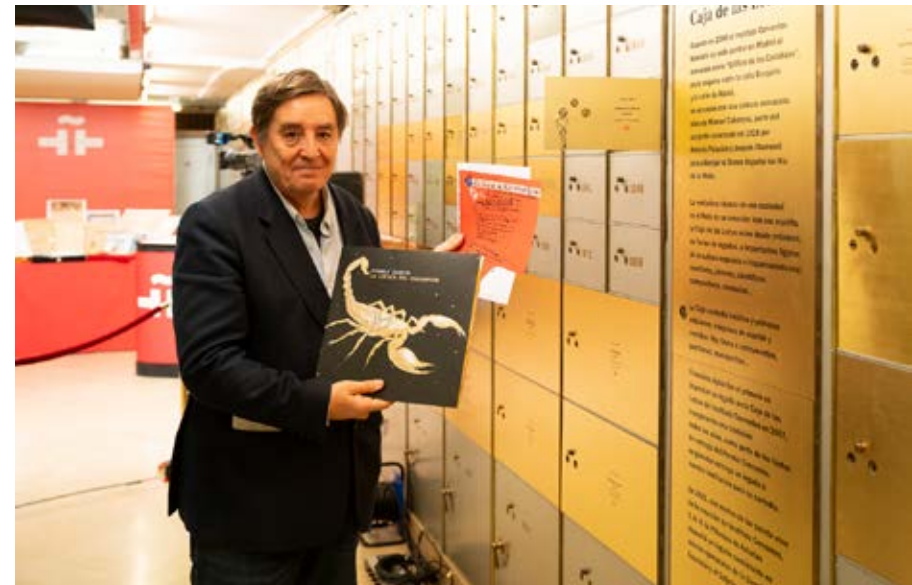
Luis García Montero mostrando el disco autografiado La lógica del escorpión , un fragmento de la letra escrita a mano de la introducción y la letra firmada de la canción «Los dinosaurios».

Charly García (08/05/2025). La mítica canción «Los dinosaurios», que recuerda la angustia y la incertidumbre de las desapariciones durante la dictadura argentina, la letra manuscrita de «La lógica del escorpión» (basada en la fábula de Esopo de la rana y el escorpión) y el álbum homónimo donde está contenida fueron el legado que el músico argentino Charly García entregó a la Caja de las Letras del Instituto Cervantes, en un acto íntimo en su domicilio de Buenos Aires. Fue el director del Instituto Cervantes quien le dio a García la llave de la caja n.º 1667, donde se encuentran sus objetos legados, y quiso expresar la admiración que siente por el músico, arreglista, productor y letrista argentino.