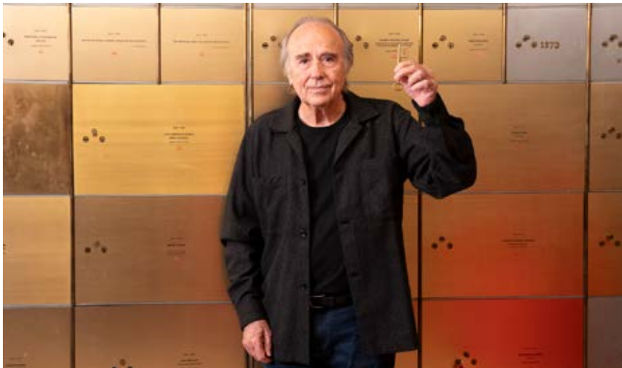
Serrat mostrando la llave de su caja n.º 1276 en la Caja de las Letras.

La caja n.º 1276 del Instituto Cervantes recibió el primer disco grabado en catalán en el año 1965 por Serrat. También se introdujo la partitura original de la grabación con orquesta de Mediterráneo , con alguna tachadura del puño y letra del cantautor.