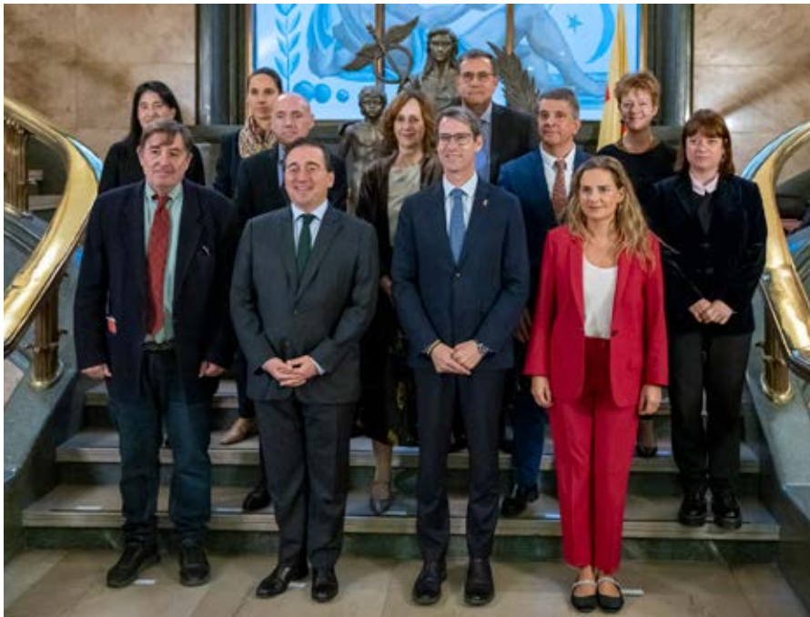
Foto de familia de autoridades en la presentación del Observatorio Global del Español celebrada en la sede central del Instituto Cervantes.

Intervinieron, junto al director del Instituto Cervantes, José Manuel Albares, ministro de Asuntos Exteriores, Unión Europea y Cooperación, y Gonzalo Capellán, presidente de la comunidad autónoma de La Rioja. A continuación, se celebró una mesa