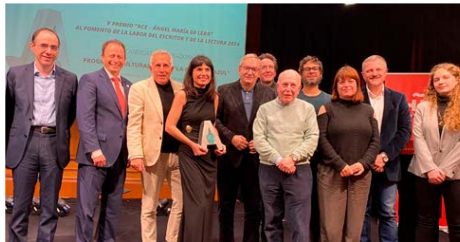
Personal organizador, participantes y premiada en el V Premio ACE - Ángel María de Lera.

El 10 de diciembre de 2024, el Instituto Cervantes acogió en su sede central la V Edición del Premio ACE Ángel María de Lera al fomento de la labor del escritor y la lectura, como reconocimiento al fundador de la asociación y para el desarrollo y defensa de los derechos de los escritores y de la libertad de expresión, que organiza la Asociación Colegial de Escritores.