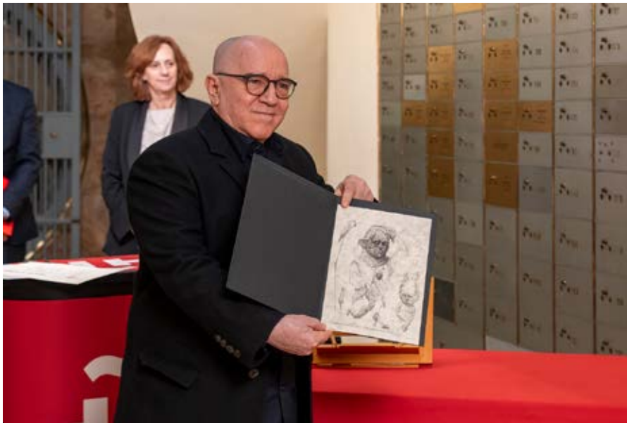
El artista, Roberto Fabelo, mostrando una de sus obras depositadas en el legado a la caja n.º 886.

Roberto Fabelo (26/02/2025). Roberto Fabelo depositó su legado en la Caja de las Letras el pasado 26 de febrero tras la inauguración de la exposición «Grafomanía. Roberto Fabelo». El artista donó a perpetuidad al Instituto Cervantes varios de los dibujos incluidos en la exposición, la cafetera intervenida que lleva el título de Mama mía , además de una pieza inédita en seda, de gran formato, relacionada con el Quijote , que lleva el título El sueño de Alonso Quijano y que quedará expuesta a la entrada de la Caja de las Letras.