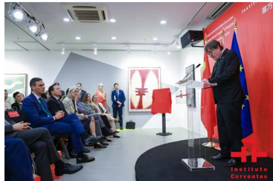
Palabras del director del Instituto Cervantes, Luis García Montero, en la inauguración del centro de Shanghái.

Hereda de la Biblioteca Miguel de Cervantes —gestionada por el Instituto desde su apertura— más de 12.000 libros en castellano y en las otras tres lenguas cooficiales, cubriendo un amplio espectro de géneros, desde la narrativa al teatro o la poesía, de España e Hispanoamérica, así como diccionarios y materiales para la enseñanza de la lengua. Destaca una colección con idiosincrasia local, compuesta por traducciones de obras del chino al español y del español al chino, así como títulos sobre China originalmente escritos en español, que reivindican la tradición sinológica de España y la labor que realizan los investigadores y traductores hispanohablantes y chinos.