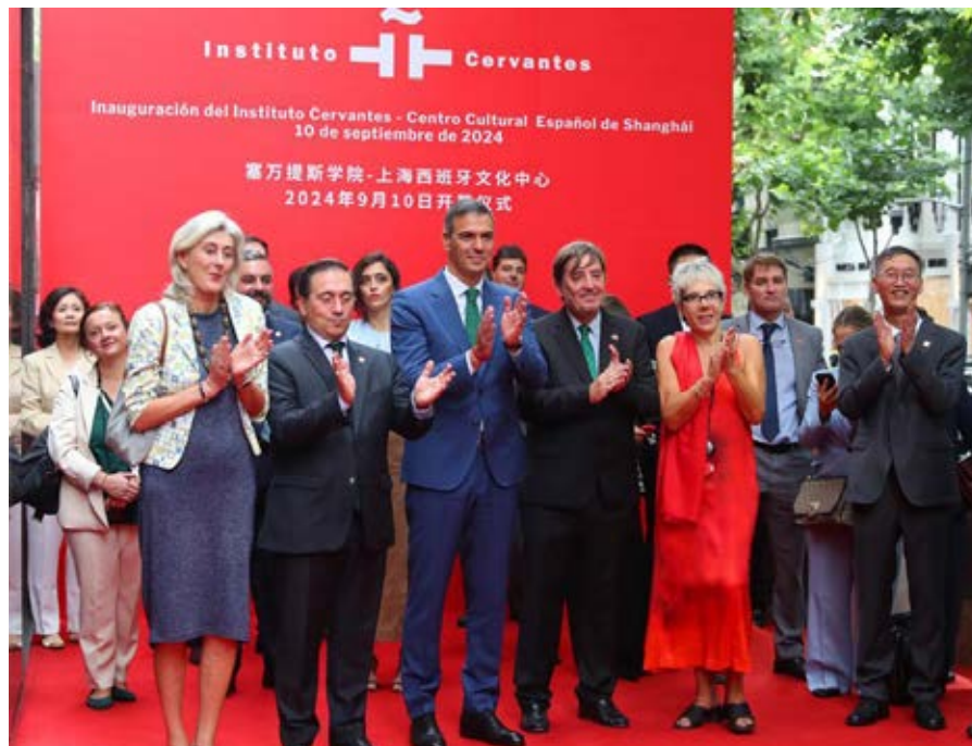
Autoridades en la inauguración del centro del Instituto Cervantes de Shanghái.

El Instituto Cervantes de Shanghái tiene una superficie de 1.200 metros cuadrados y está ubicado en la calle Anfu, en la antigua «concesión francesa», uno de los enclaves históricos de la capital económica, en el que conviven edificios de carácter europeo y otros de diseño vanguardista. Es el barrio de la cultura y del diseño por excelencia, donde se encuentran, por ejemplo, algunas casas-museo de artistas del período revolucionario, institutos de artes escénicas, teatros y cines, así como numerosas galerías y cafés.