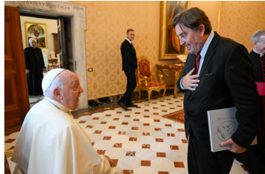
El director del Instituto Cervantes es recibido por Su Santidad el papa Francisco en audiencia privada.

También cuando era profesor, en 1965, Bergoglio consiguió que Jorge Luis Borges —«un tipazo», según sus palabras— tomara un autobús y fuera a visitar a sus alumnos. Con ellos hizo un taller de narrativa del que salió un libro de cuentos con prólogo del autor de El Aleph y que el próximo año publicará el Instituto Cervantes —cuando se cumplen sesenta años de aquel momento— junto con la carta que el papa le escribió a Borges en defensa de la literatura en la educación. «Tenéis todo el permiso para poder