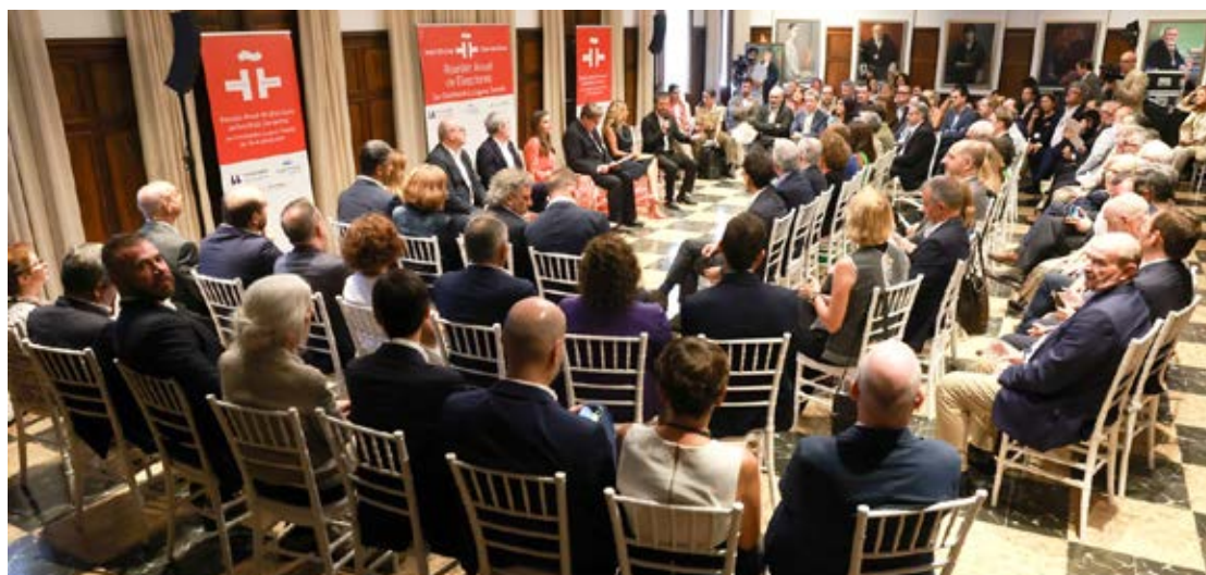
Asistentes a la reunión de trabajo presidida por S. M. la Reina y autoridades celebrada en la Universidad de San Cristóbal de La Laguna.