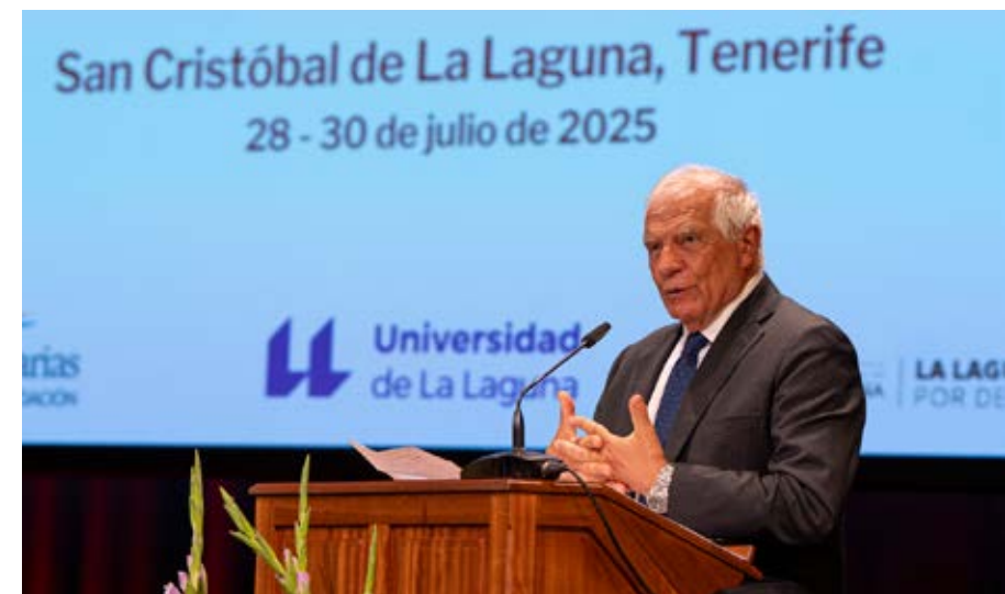
Intervención institucional de Josep Borrell, presidente de CIDOB (Barcelona Centre for International Affairs), ex alto representante de la Unión Europea para Asuntos Exteriores y Política de Seguridad y exministro de Asuntos Exteriores, Unión Europea y Cooperación.

El director del Cervantes explicó durante su discurso que el objetivo de esta reunión es el de analizar lo hecho hasta ahora, pero también «ilusiones y proyectos» futuros, con especial atención a la importancia de algunas palabras en la actualidad, como «libertad, cayuco, genocidio o mestizaje».