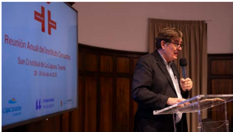
Palabras de clausura del director del Instituto Cervantes, Luis García Montero.

Durante su intervención, García Montero remarcó, en alusión al Plan de Transformación Digital, que hay cambios de época que «son muy significativos», lo que ha llevado a diseñar un plan que «responda a las nuevas realidades». El director del Cervantes incidió en que el objetivo de este plan es el de unificar servicios y comunicaciones, y lograr una mayor eficacia con las posibilidades y servicios de la institución.