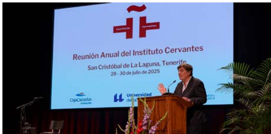
Intervención institucional de Luis García Montero, director del Instituto Cervantes.

La inauguración de la Reunión Anual se celebró el lunes 28 de julio en el Paraninfo de la Universidad de La Laguna, institución