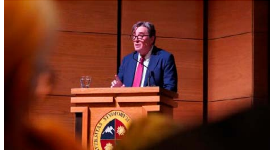
El director del Instituto Cervantes participa en el XXII Congreso de la Asociación Internacional de Hispanistas (AIH), celebrado en Santiago de Chile.

El XXII Congreso de la Asociación Internacional de Hispanistas se celebró en Santiago de Chile entre el 21 y el 26 de julio. Este encuentro, en el que colabora el Cervantes, está organizado por un consorcio de universidades chilenas coordinado por el Instituto de Literatura de la Universidad de los Andes y sirve como espacio de reflexión a los debates actuales referidos al estudio de la lengua, la literatura y la cultura hispánicas.