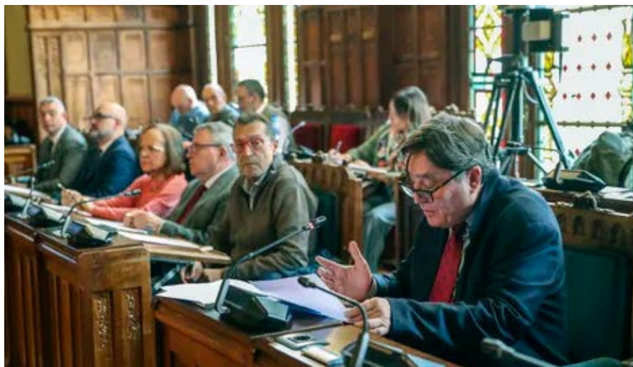
Intervención de Luis García Montero en la Junta General del Principado de Asturias.

El jueves 3 de abril el director del Instituto Cervantes, Luis García Montero, compareció ante la Junta General del Principado de Asturias —el parlamento autonómico—, en calidad de catedrático de Literatura Española de la Universidad de Granada y responsable de la institución cervantina, para participar en el debate sobre la declaración oficial del asturiano en esta comunidad autónoma. Formó parte del grupo de 47 expertos y representantes institucionales invitados por formaciones políticas que acudieron al parlamento para asesorar en esta cuestión, que también contempla la oficialidad del eonaviego en la región.