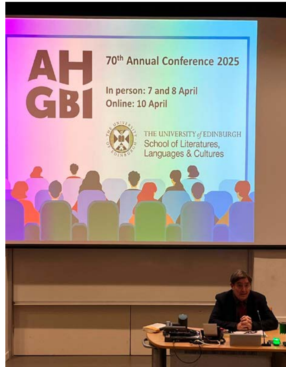
Conferencia plenaria inaugural del encuentro de la Asociación de Hispanistas de Gran Bretaña e Irlanda, impartida en la Universidad de Edimburgo por el director del Instituto Cervantes.

El director del Instituto Cervantes viajó a Bogotá entre el 25 y el 29 de abril para asistir a la ceremonia de inauguración de la Feria Internacional del Libro de Bogotá 2025 y a la inauguración del Pabellón de España.