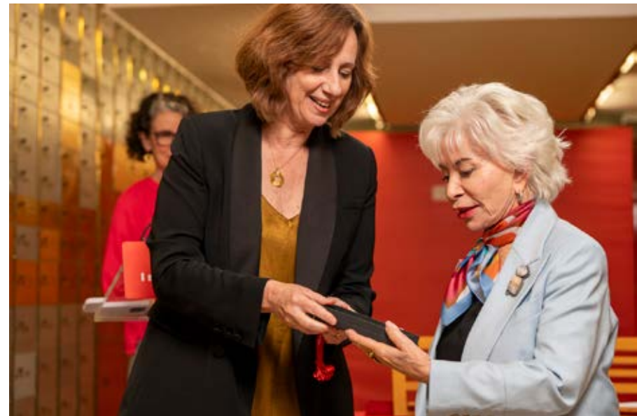
Carmen Noguero, secretaria general del Instituto Cervantes, hace entrega de la llave de la Caja n.º 989 a Isabel Allende.