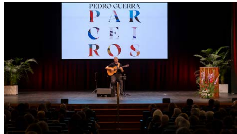
Actuación de Pedro Guerra.