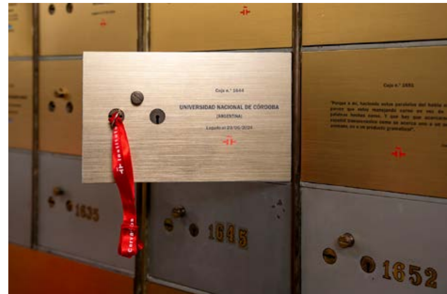
Caja n.º 1644 de la Universidad Nacional de Córdoba en la Caja de las Letras del Instituto Cervantes.