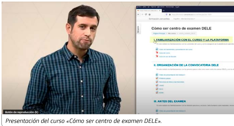
Presentación del curso «Cómo ser centro de examen DELE».

La administración de los exámenes DELE se realiza exclusivamente a través de una red de centros reconocidos a tal efecto. Hay actualmente más de 1.000 centros de examen, repartidos en cerca de 120 países. La red de centros de examen DELE cuenta con centros tanto públicos como privados en más de 700 ciudades de todo el mundo. Ser centro de examen DELE conlleva gestionar y organizar tanto la parte logístico-administrativa como la difusión comercial de las convocatorias a los exámenes DELE que tienen lugar cada año.