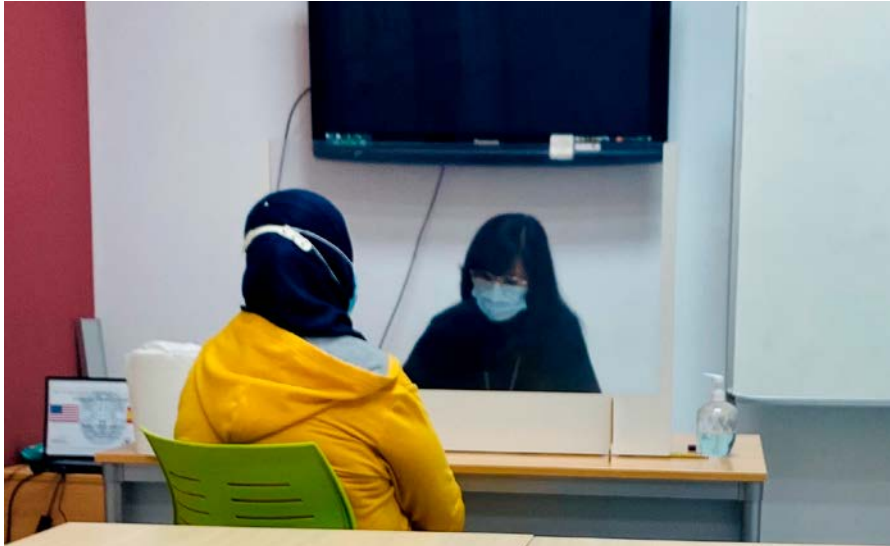
Administración oral de la prueba CCSE para personas no alfabetizadas (CCSE-NA).

de las preguntas y seleccionando aquellas con los contenidos más relevantes. El resultado está siendo muy satisfactorio.