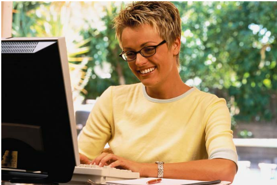
Cursos en línea de acreditación y de actualización de examinadores DELE.

Los cursos de acreditación se están trasladando a la nueva plataforma de Moodle del Instituto Cervantes, donde ya se ofrece el curso de actualización y el curso «Cómo ser centro de examen DELE». Para final del año académico, los cursos de acreditación se impartirán desde la nueva plataforma.